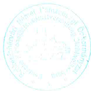
/ :Schneider Éva: / elnök