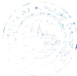
/ :Schneider Éva: / elnök